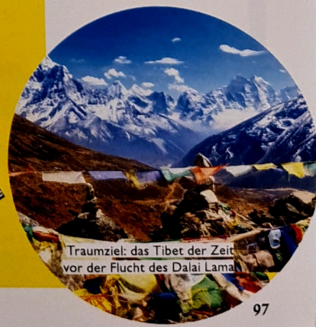
Traumziel: das Tibet der Zeit vor der Flucht des Dalai Lama

Als Minh-Khai erfuhr, dass ihre große Liebe Elvis Presley schon längst gestorben war, platzen natürlich ihre Hochzeitspläne